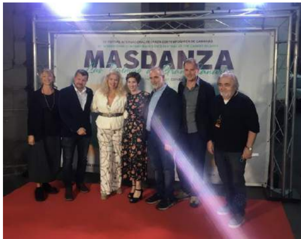
A speciális zsűri tagjai

2021. október 19-24.: a Masdanza-n, Spanyolországban Batarita szaktanácsadóként, a nemzetközi koreográfus verseny speciális zsűrijeként volt jelen, immáron 6.alkalommal.